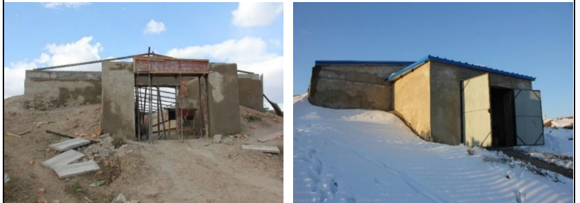
Зураг 9: Борнуур сумын 150-200т-ын багтаамжтай сонгины

“Борнуур сумын 150-200т-ын багтаамжтай сонгины зоорийг өргөтгөн засварлаж, тоног төхөөрөмж суурилуулав”. Үүний