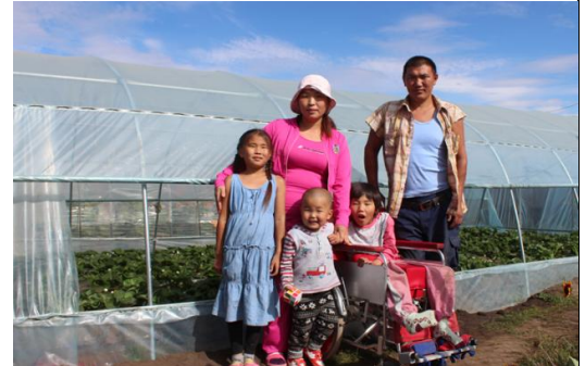
Зураг 12: Жишиг өрх, Тодгэрэлийн гэр бүл