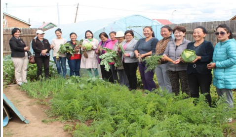
Зураг 13: Талбайн сургалт

Тогтмол хэрэглэж чаддаггүй шим тэжээлт ногоо тариалж жилийн туршид хэрэглэх аргад сургах зорилгоор хэрэглээний сургалтууд зохион байгуулах ажлын хүрээнд: Шим тэжээлт ногоогоор хоол хийх сургалтыг хоол тэжээлийн мэргэжлийн сургалтын төвтэй, хүнсний ногоо дахин боловсруулах, жилийн туршид шим тэжээлт чанарыг нь алдагдуулахгүй хадгалж хэрэглэх технологийн сургалтыг Хөдөлмөр эрхлэлтийг дэмжих төвтэй, бизнесийн мэдлэг олгох болон маркетингийн сургалтыг Гадаад орчны боловсролын институттэй тус тус хамтарч 6 удаагийн сургалт зохион байгууллаа. Сургалтанд 643 хүн хамрагдсаны 480 нь эмэгтэйчүүд байлаа. Сургалтын үр дүнд сурсан зүйл, ургуулсан ногоогоороо 2 өрх Намрын ногоон өдрүүд арга хэмжээнд оролцож, 126 шил нөөшилсөн, 423 уут хатааж савалсан ногоог борлуулж 386'000 төгрөгний орлого олох боломж бүрдсэн. Мөн 2 жишиг гудамжны 4 өрх 1.3т төмс хүнсний ногоо борлуулж, 650'000 төгрөгний борлуулалт хийжээ.