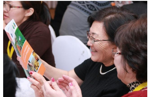
Зураг 10: Хүнсний ногооны маркетингийн форум