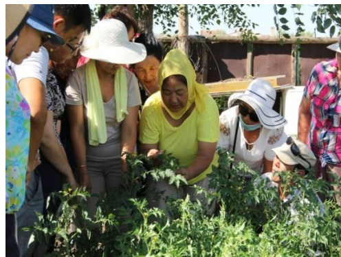
Зураг 6: Хүлэмжийн сургалт, Дорнод аймаг

МНТ-ийн эхний “Нийлэг хальсан хүлэмжинд хүнсний ногоо ургуулах” гарын авлагыг бэлтгэн гаргав. Хүлэмжийн үндсэн 5 таримал болон зарим навчит ногоо ургуулах технологи, ургамал хамгааллын сэдвүүдийг хамарсан.