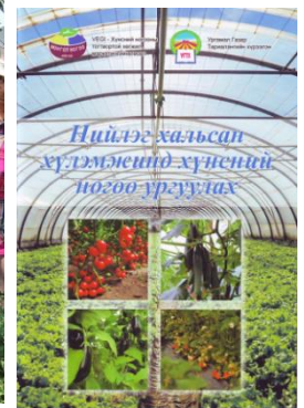
Зураг 7: Хүлэмжийн ногооны гарын авлага

Хүснэгт 2: Шууд ба шууд бус үр шим хүртэгчид, хүнсний ногоо тариалсан талбай, ургацын хэмжээг 2015, 2016 онтой харьцуулав.