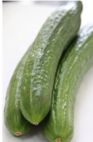
Зураг 1: Өргөст хэмхийн Саладин сорт

2016 онд Улсын сорт сорилтын зөвлөл (УССЗ) хуралдаж, хүлэмжийн өргөст хэмхийн Саладин F1, улаан лоолийн Толстой F1 эрлийз сортуудыг ирээдүйтэйгээр баталлаа.