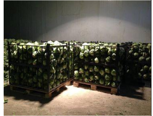
Зураг 3: Байцаа хадгалах зориулалтын хайрцаг, Сэлэнгэ аймгийн Мандал сум