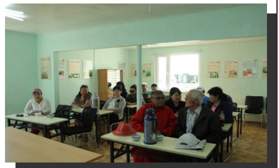
Зураг 5: Дархан-Уул аймгийн Орхон суманд экстейншин төв нээгдлээ