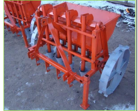
Зураг 4: Мандал сумын тариаланч залуу 4 мөрийн сонгины үрлэгчийг зохион