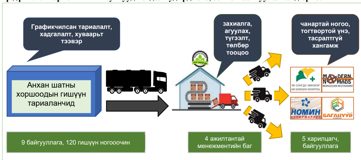
Үр дүн 2.2: Маркетингийн сувгууд нэгдсэн удирдлага, зохион байгуулалтанд орно.

Улаанбаатар хотын төмс, хүнсний ногооны бөөний зах Улаанбаатар хотын хүн амыг эрүүл хүнсний бүтээгдэхүүнээр жилийн турш найдвартай, тогтвортой хангах, ногоочдыг борлуулалтаар дэмжих 10 га талбай бүхий хадгалалт, борлуулалтын төв 2020-2021 онд байгуулагдахаар төлөвлөгдсөн. Энэ ажлын хүрээнд төсөл нь тариаланчдыг тус бөөний төвийн үйл ажиллагаанд зохион байгуулалттай оролцох нөхцийг урьдчилан бүрдүүлж, чадавхжуулах чиглэлийн үйл ажиллагаануудыг хэрэгжүүлэн ажиллаж байна. Тус зах байгуулагдах үед ногоочдын байгуулсан дундын хоршоо нь ногоочдыг борлуулалтаар дэмжих үйл ажиллагаанд менежментийн болон дилерийн үүргийг гүйцэтгэх юм. Өнөөдрийн хийгдэж буй дундын хоршооны ажлууд олон талаараа дээрх зорилготой нийцэж байна.