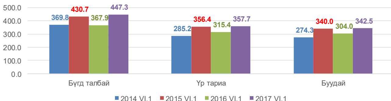
Тариалсан талбай, төрлөөр, жил бүрийн 6 дугаар сарын 1-ний байдлаар, мянган га

Өмнөх оны мөн үеийнхээс нийт тариалсан талбай 79.4 мян.га буюу 21.6 хувь, үүнээс үр тарианых 42.3 мян.га буюу 13.4 хувиар, тэжээлийн ургамлынх 7.7 мян.га буюу 2.3 дахин, төмс тариалсан талбай 0.6 мян.га буюу 5.5 хувиар, хүнсний ногоо 0.06 мян.га буюу 1.1 хувиар нэмэгдсэн байна.