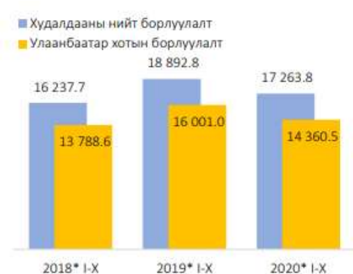
Зураг 3. УБ хотын худалдааны нийт борлуулалт, жил бүрийн эхний 10 сард, тэрбум төгрөг