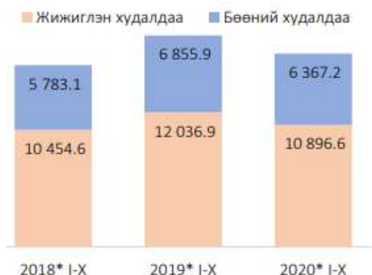
Зураг 2. Худалдааны салбарын нийт борлуулалт, жил бүрийн эхний 10 сард, тэрбум төгрөг

Жижиглэн худалдааны борлуулалтын орлого 2020 оны эхний 10 сард 11.0 их наяд төгрөг болж, өмнөх оны мөн үеэс 1.1 (9.5%) их наяд төгрөгөөр, бөөний худалдааны борлуулалтын орлого 6.4 их наяд төгрөг болж, өмнөх оны мөн үеэс 488.7 (7.1%) тэрбум төгрөгөөр тус тус буурсан байна.