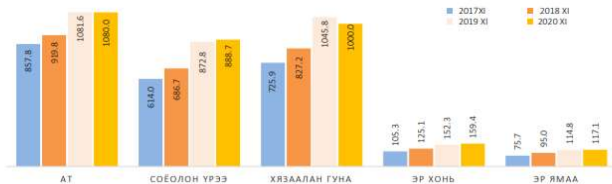
Зураг 4. Нас гүйцсэн малын дундаж үнэ, жил бүрийн 11 дүгээр сард, мянган төгрөгөөр

Малын зах зээлийн дундаж үнийн мэдээллээр 2020 оны 11 дүгээр сард ат 1.1 сая төгрөг, хязаалан гуна 1.0 сая төгрөг, соёолон үрээ 888.7 мянган төгрөг, эр хонь 159.4 мянган төгрөг, эр ямаа 117.1 мянган төгрөг байна.