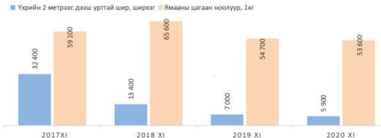
Зураг 7. Мал аж ахуйн бүтээгдэхүүний зах зээлийн дундаж үнэ, жил бүрийн 11 дүгээр сард, төгрөг

Мал аж ахуйн бүтээгдэхүүний зах зээлийн дундаж үнийн мэдээллээр 2020 оны 11 дүгээр сард үхрийн 2 метрээс дээш урттай шир 5.9 мянган төгрөг, ямааны цагаан ноолуур кг-ын үнэ 53.6 мянган төгрөг байна.