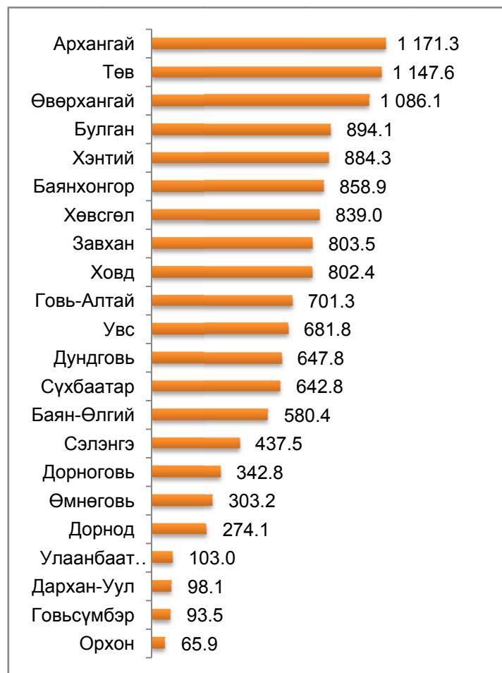
Төллөсөн хээлтэгч, аймаг, нийслэлээр, 2014 оны эхний 4 сард, мян.толгой

Гарсан төлийн 98.8 хувь буюу 13345.1 мян.толгой төл бойжиж байгаа нь өмнөх оны мөн үеийнхээс 1867.6 мянга буюу 16.3 хувиар их байна. Хээлтүүлэгт орвол зохих 67.2 мянган ингэний 86.8 хувь буюу 58.3 мянга нь энэ оны 5 сарын 1-ний байдлаар хээлтүүлэгт орсон байна.