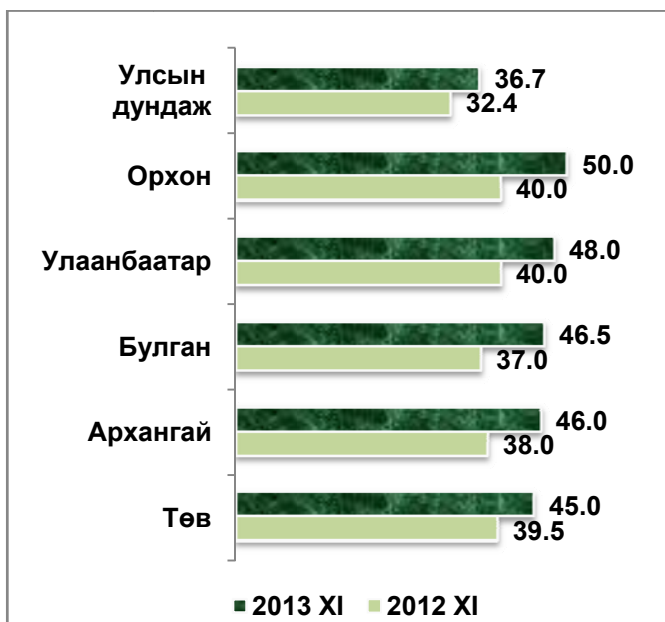
Үхрийн 2 м-ээс дээш урттай 1 ширхэг ширний зах зээлийн дундаж үнэ, жил бүрийн 11 дүгээр сард, мян.төг