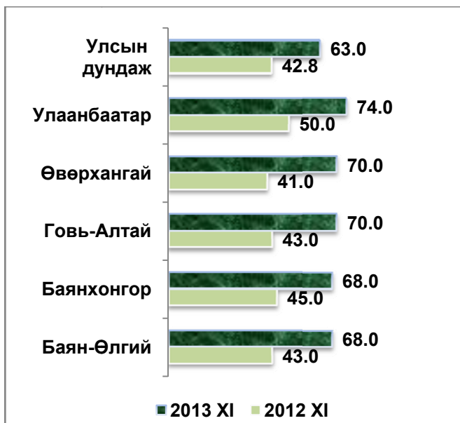
Ямааны 1 кг цагаан ноолуурын зах зээлийн дундаж үнэ, жил бүрийн 11 дүгээр сард, мян.төг